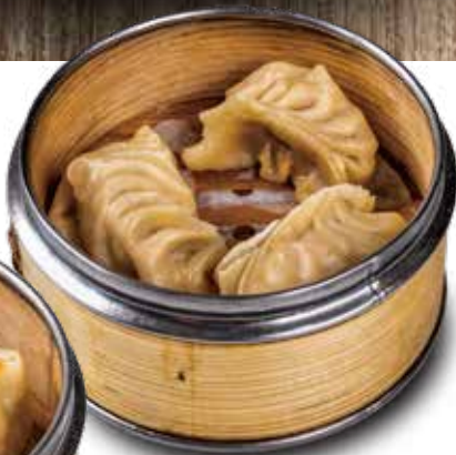
4. GYOZA 4PZ maiale, verdure 4,00€