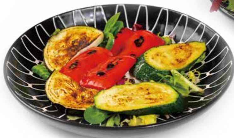
240. MISTO DI VERDURE ALLA GRIGLIA PEPERONI, ZUCCHINE, MELANZANE 4,50€