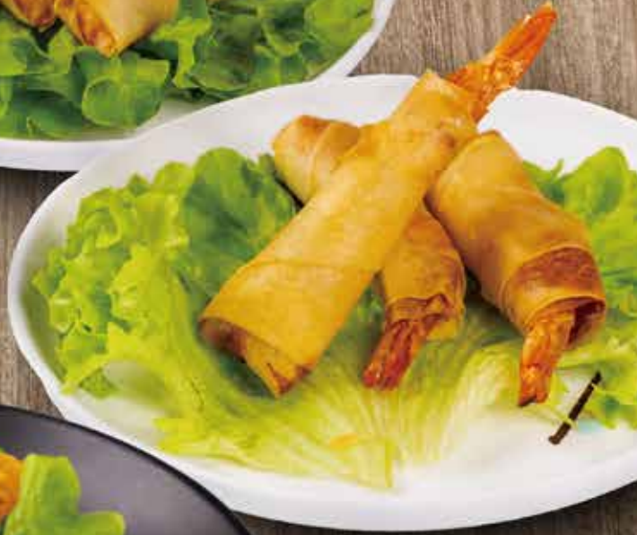
2. INVOLTINI DI GAMBERI 3PZ gambero 3,50€