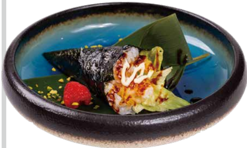
92. TEMAKI EBITEN gambero fritto, insalata, maionese, teriyaki 4,50€