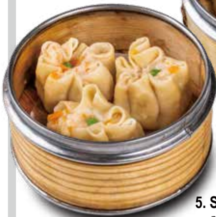
5. SHAO MAI 4PZ pesce, gambero, verdure 4,00€