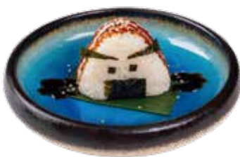
71. ONIGHIRI MIURA salmone scottato, philadelphia, teriyaki 4,50€