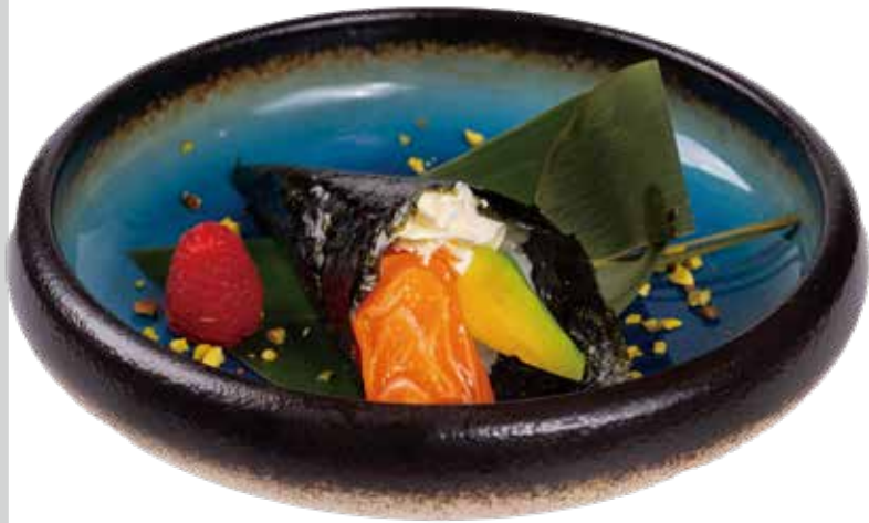
90. TEMAKI SHAKE salmone, avocado, philadelphia 4,50€