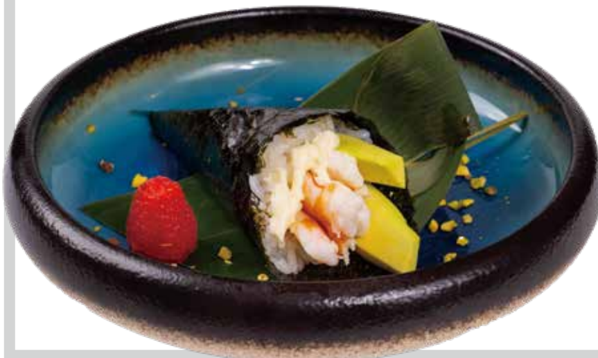
93. TEMAKI EBI gambero cotto, avocado, maionese 4,50€