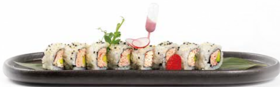
100. CALIFORNIA 8PZ surimi, avocado, maionese, sesamo 7,00€