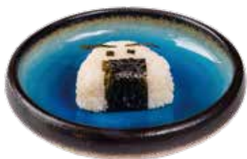
70. ONIGHIRI SHAKE salmone speziato piccante, sesamo 4,50€