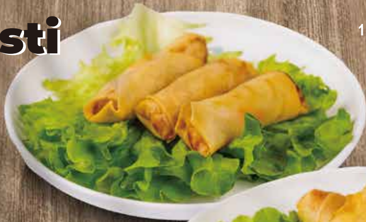
1. INVOLTINI PRIMAVERA 3PZ verdure 3,00€