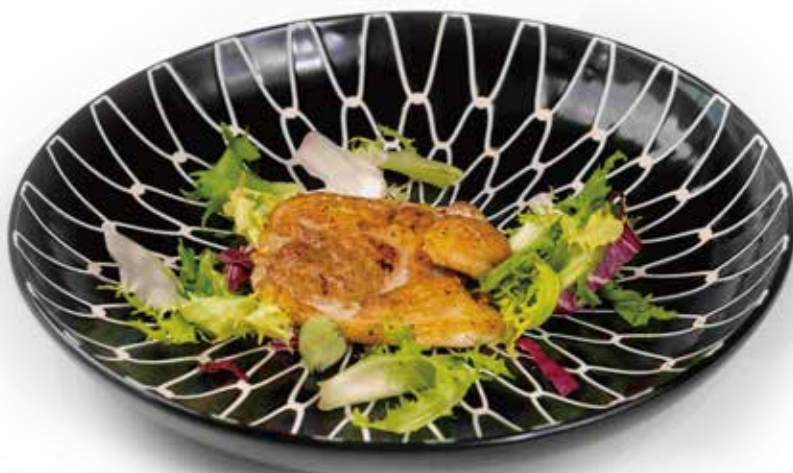
242. POLLO ALLA GRIGLIA 4,50€