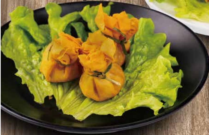
3. FAGOTTINI ORIENTALE 4PZ gambero, verdure 4,00€